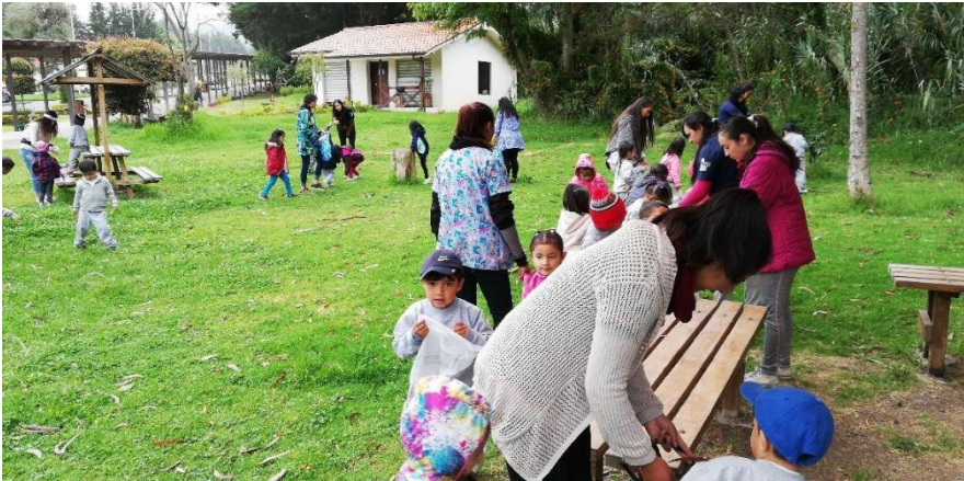
Imagen.5: recolección de material.

campus de nivelación de la UNAE donde el objetivo de la actividad era que los niños se relacionen con el ambiente además de recoger material que sea de su interés, puesto que el atelier es un espacio dinámico que busca desde su estética, experimentar de una forma libre, independiente y a su vez cooperativa.