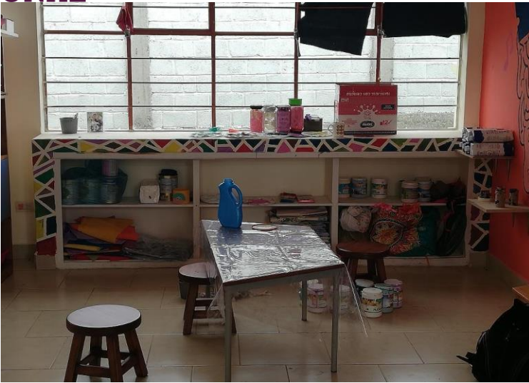
Imagen. 9: área de masas.