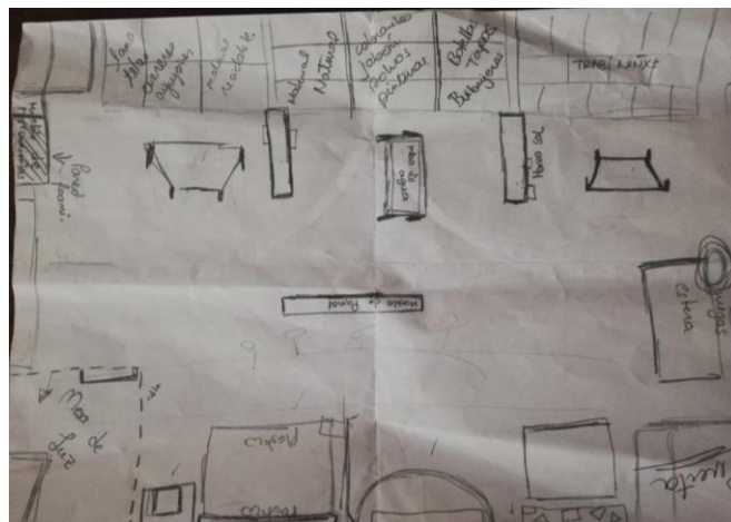
imagen. 7: Boceto readecuación del espacio.

Con esta información y los materiales recolectados en la salida pedagógica se procedió a la primera readecuación del lugar con los materiales existentes dentro del espacio (ver imagen 7).