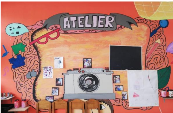
Imagen. 17: Mural.

Al momento de las actividades se podía captar como todos los materiales y la distribución del aula toma el papel principal para que los niños se motiven a explorar y experimentar (ver imagen 17 y 18).