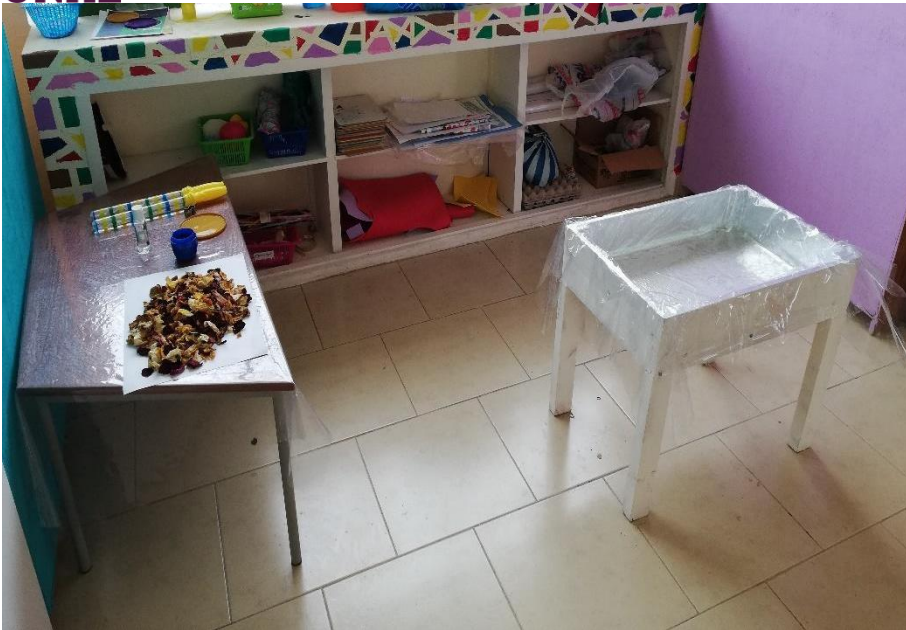
Imagen. 10: Área de agua.