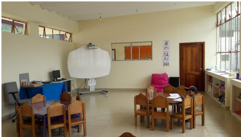
Imagen 2. Panorámica del salón Atelier. Fuente: Elaboración propia.

Panorámica del salón Atelier. Fuente: Elaboración propia.