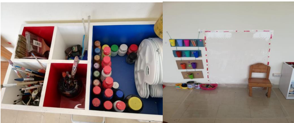
Imagen. 14: conjunto de fotos área plástica.

Dajhanna Pahola Carranza Díaz C.I: 1312285552