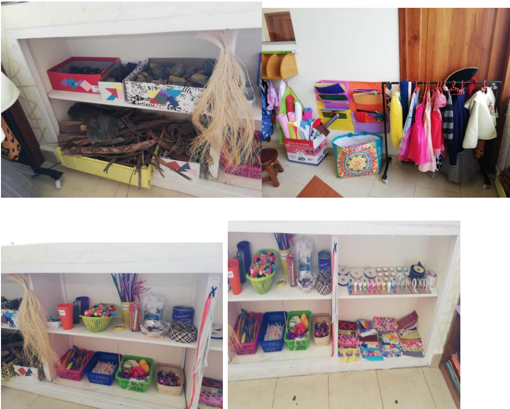
Imagen. 12: Conjunto de imágenes área de telas.

3. La tercera área de trabajo es la de telas, en donde los materiales son diversos como: telas, cintas, lana, tijeras, material natural, disfraces, etc. (ver imagen 12).