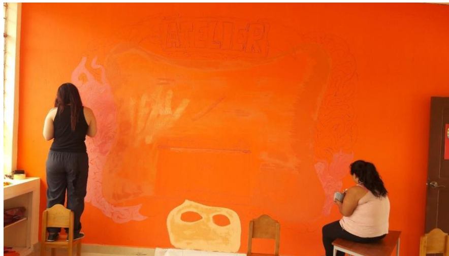
Imagen 4. Elaboración mural.

Al finalizar la valoración e inventario se realizó una salida pedagógica con los niños para la recolección de materiales varios, entre ellos hojas, piedras, ramas, etc. Esta salida tenía como lugar de recolección el