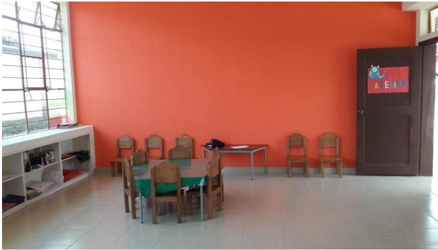
Imagen 3. Panorámica ubicación de mesas. Fuente: Elaboración propia