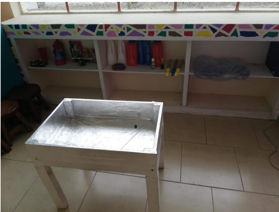
Imagen. 11: Mesa de agua.

Dajhanna Pahola Carranza Díaz C.I: 1312285552