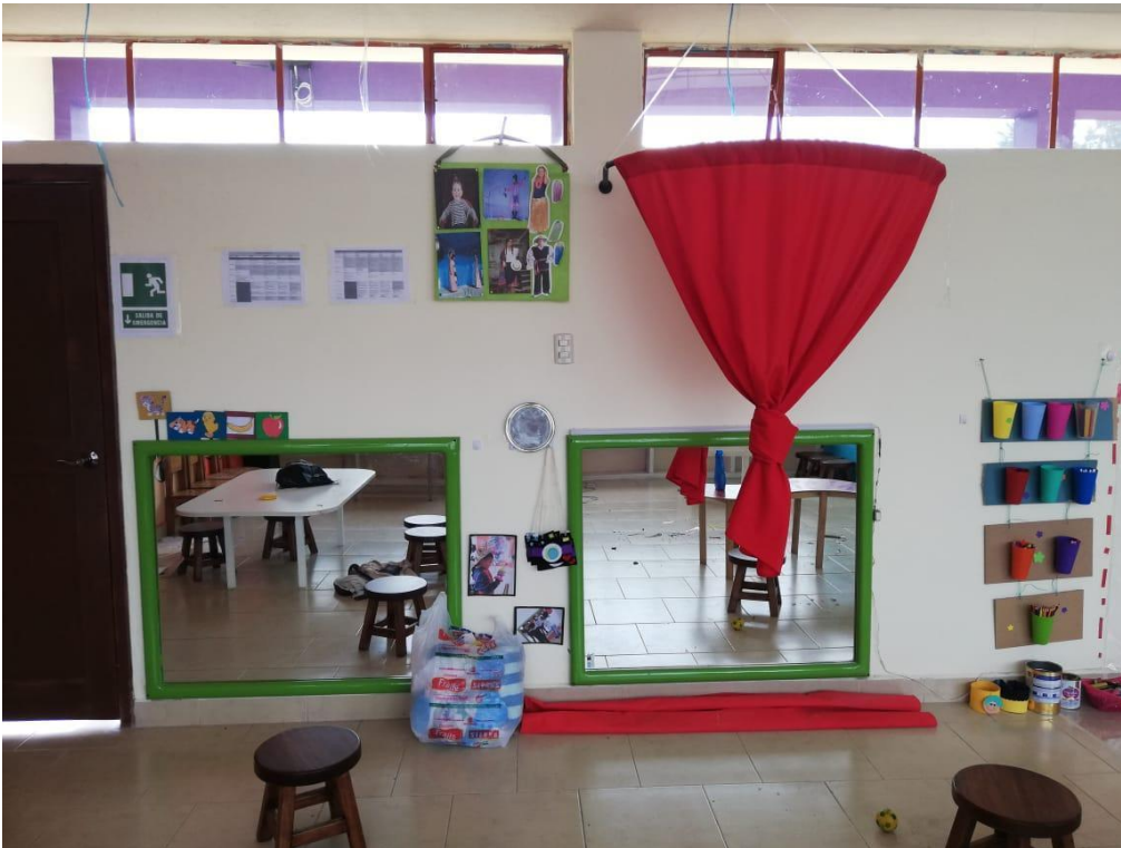
Imagen.15: área espejos.

6. La sexta área de trabajo es en los espejos donde los niños son libres para reconocerse y apropiarse de lo que son (ver imagen 15).