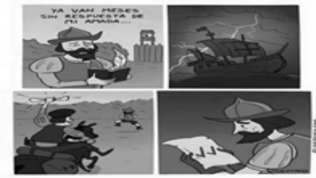
Figura 2. Discurso multimodal