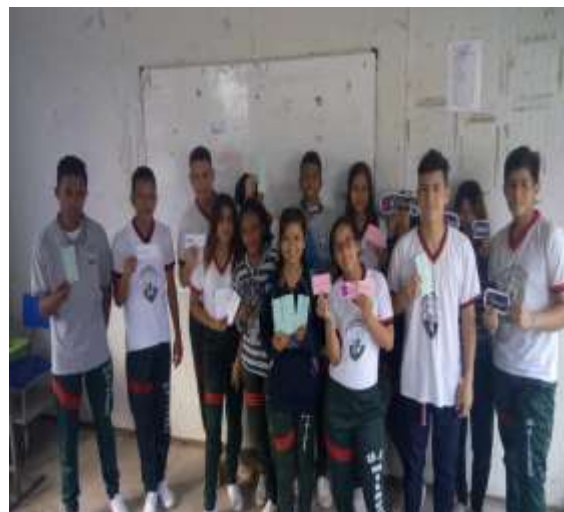
Estudiantes intercambiando tarjetas con extranjerismos