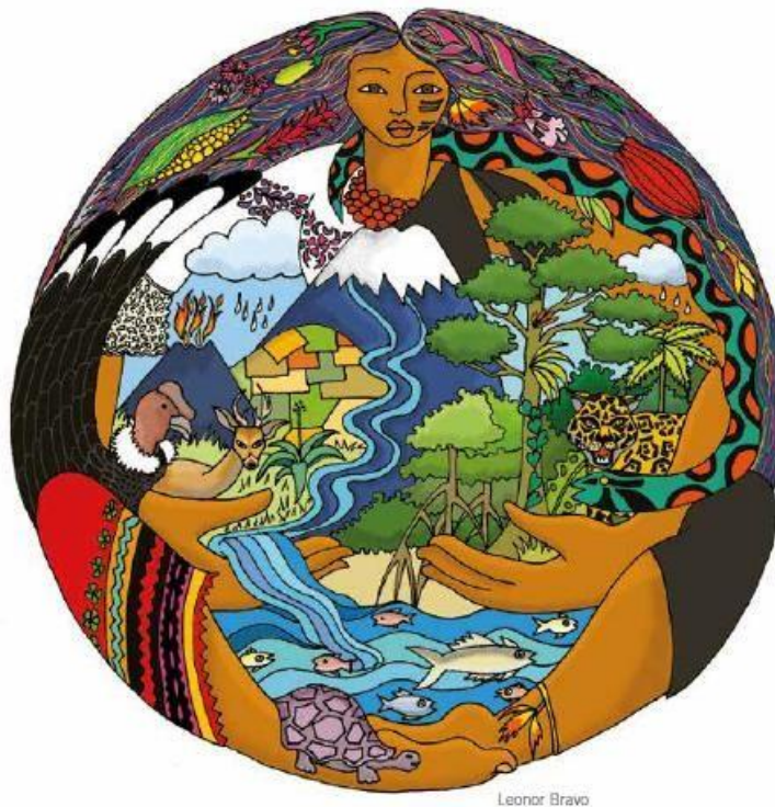
Imagen N°1: