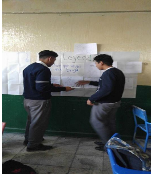
Creaciones literarias (La leyenda) hechas por los alumnos.